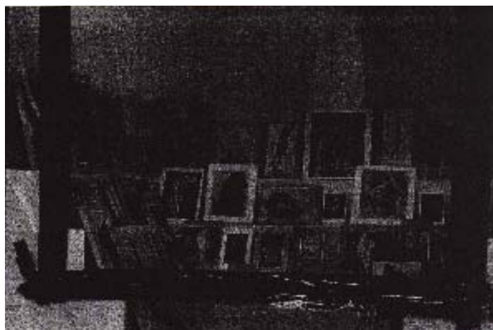
← 7 Thomas Hirschorn, Skulptur Sortier Station (Station de tri de sculptures) , 1997. Installation, dix vitrines; détail de la vitrine 9 : «Collection de sculptures» (coupures de presse collées sur bois et/ou sur polystyrène). Centre Pompidou, Musée national d'art moderne, Paris. Achat, 2000. AM 2000-41

Muse: Artists Reflect , cat. exp., New York, The Museum of Modern Art, 1999. Cf. également A.A. Bronson, Peggy Gale (dir.), Museums by Artists , cat. exp., Toronto, Art Metropole, 1983; Uwe M. Schneede (dir.), Ein-Räumen. Arbeiten im Museum. 61 aktuelle Projekte in der Hamburger Kunsthalle , cat. exp., Hambourg, Hamburger Kunsthalle; Ostfildern-Ruit, Hatje Cantz, 2000. 37. Cf. Suzanne Pagé (dir.), Histoires de musée , cat. exp., Paris, Musée d'art moderne de la Ville de Paris, 1989. 38. Feux pâles. Une pièce à conviction , exposition réalisée avec le concours de l'agence les ready-made appartenant à tout le monde», cat. exp., Bordeaux, Capc-Musée d'art contemporain, 1990. 39. Cf. Andrea Fraser, «From the Critique of Institutions to an Institution of Critique», in John C. Welchman (dir.), Institutional Critique and After , op. cit., p. 123-135; «Institutionskritik», Texte zur Kunst , n° 59, septembre 2005, p. 40-137; «L'extradisciplinaire : vers un renouveau de la critique institutionnelle», Multitudes , n° 28, mars 2007. 40. Thomas Hirschorn, lettre à Alison M. Gingeras du 10 mars 2000.