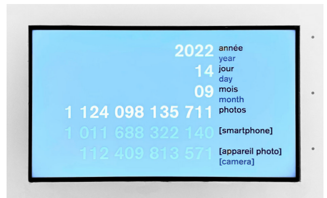
Extrait de l'exposition permanente du musée Niépce, un écran met en lumière le nombre d'images réalisées dans le monde à l'année 2022, Chalon-sur-Saône.