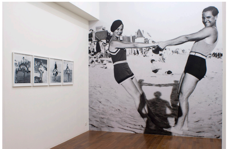
La tension , Paris, Céline Duval, 2009. Wallpaper, 387 x 368 cm ou dimensions variables, © Semiose galerie.

Finalement, le vernaculaire est une matière que les artistes aiment travailler, transformer pour adapter une historicité au présent. C'est une base existante pour ceux qui souhaitent travailler le réel sans en produire. Batchen dit que c'est l'opération faite à l'image vernaculaire, l'ajout, qui fait opérer quelque chose de mémoriel au spectateur, et c'est ce qui l'arrache au passé pour le réorienter vers le présent. On peut dire que la simple sélection de l'image lors de l'achat, est en soi, déjà une opération faite à l'image vers le présent.