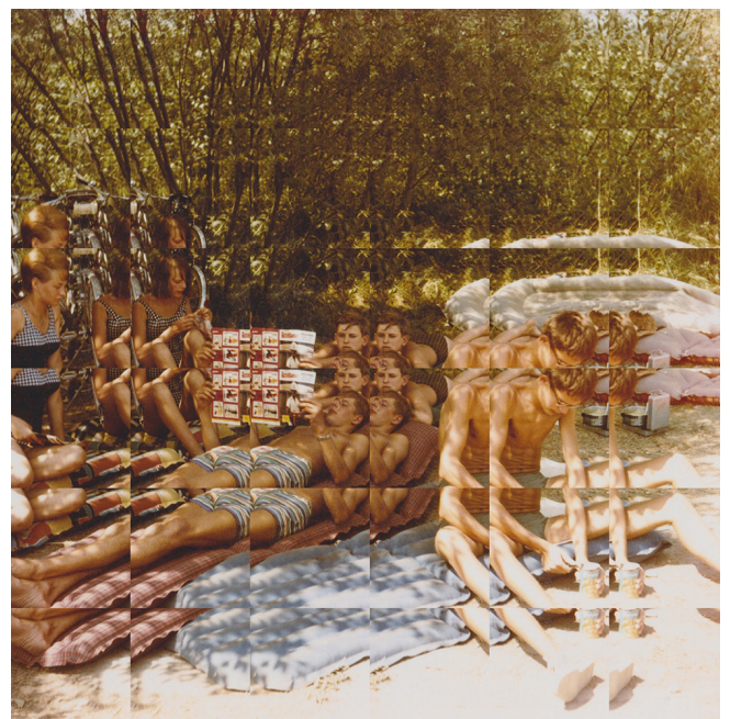
Série Spéculaire, déjeuner sur l'herbe , Édouard Taufenbach, 2018. Collage sur papier Canson, feuille d'aluminium laminée, 40x40cm, ©Édouard Taufenbach.

Avec le papier, on a avant tout l'image en tant qu'objet. Édouard Taufenbach parle d'une certaine forme de romantisme à travailler avec l'image ancienne. Le papier induit une nostalgie qui, je pense, accroît, avec l'anonymisation, une forme de hantise. La complexité de ce romantisme est de ne pas tomber dans un mauvais pathos, où une fétichisation de l'objet en tant que tel, il faut dissocier l'image en tant qu'objet de l'image elle-même.