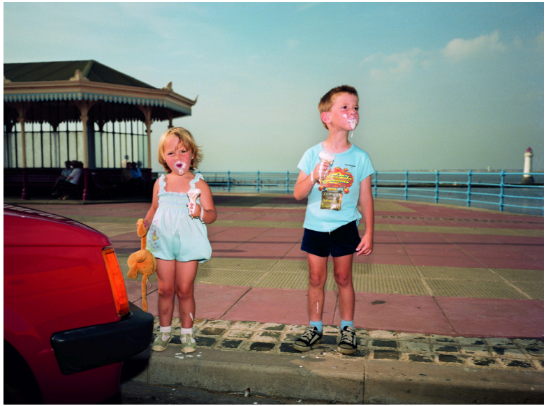
Déjà View , Martin Parr & The Anonymous Project, 2021.