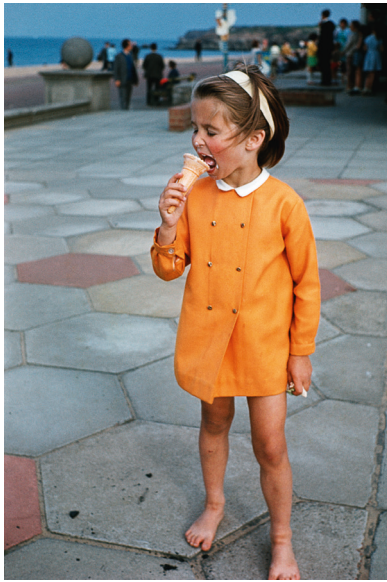
Déjà View , Martin Parr & The Anonymous Project, 2021.