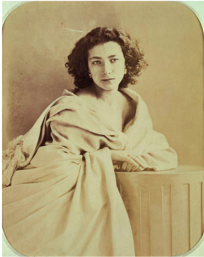
Portrait de Sarah Bernhardt par Nadar, 1864. Tirage moderne d'après un négatif verre au collodion, 24x30 cm, ©musée d'Orsay.